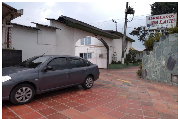
Fotografía 6. Fachada Establecimiento