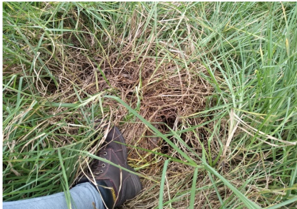
Fotografía 3. Boca del pozo pz-09-0029, sellado temporalmente.