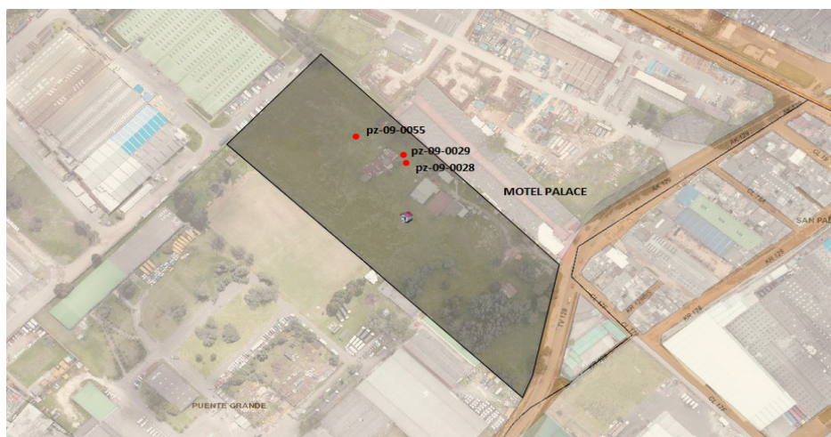
Imagen 5. Ubicación de los pozos en el predio.

En el predio donde se ubican los pozos no se desarrollan actividades económicas, el predio esta administrado por el Motel Palace ubicado al costado norte del mismo.