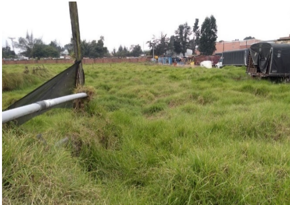
Fotografía 4. Estado del predio.