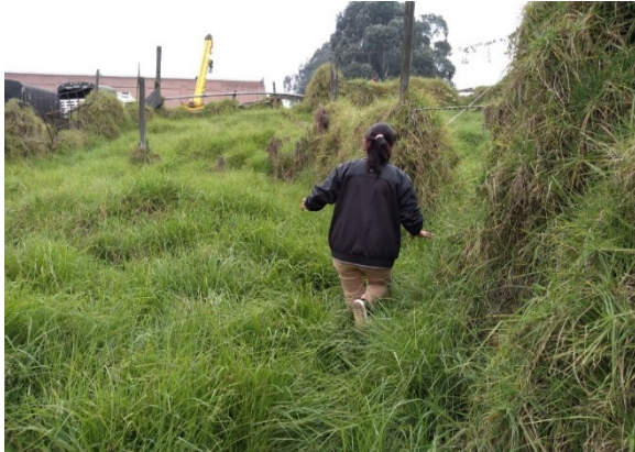
Fotografía 2. Vista del predio.