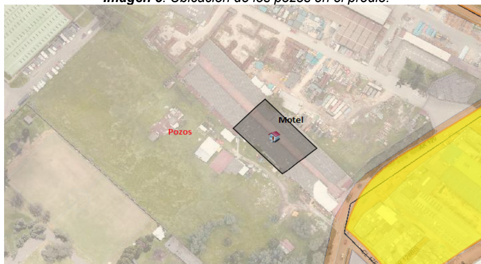
Imagen 6. Ubicación del Motel.