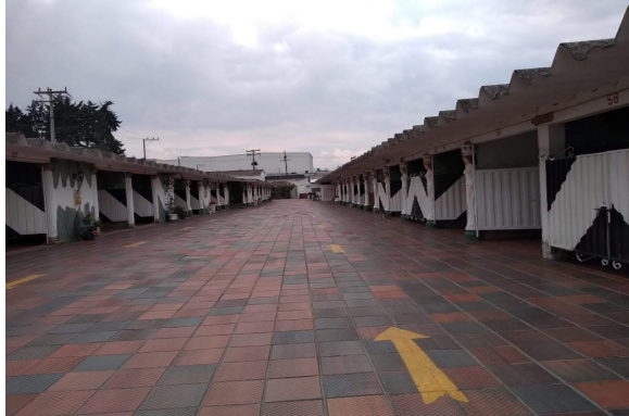
Fotografía 1. Vista del establecimiento.