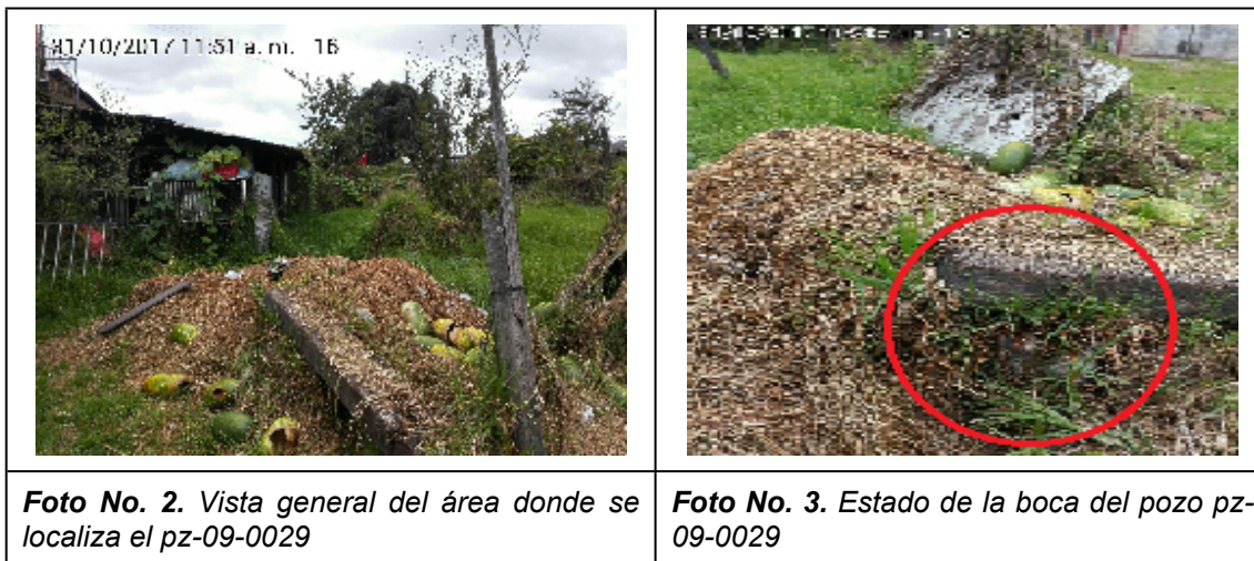
Foto No. 1. Vista frontal Motel Palace, por donde se ingresa del predio donde se localizan los pozos pz-09-0028, pz-09-0029 y pz-09-0055 (señalado por la flecha).